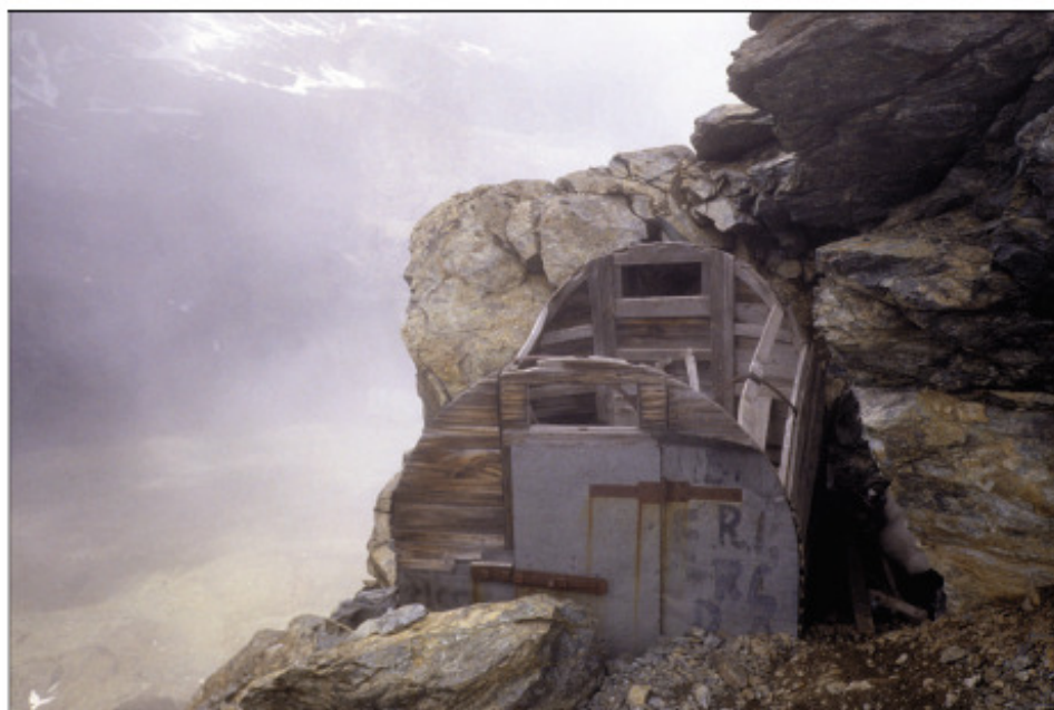
Bivacco sulla cresta delle Rocce Fourioum

contemporaneamente alle opere difensive più arretrate e agli accasermamenti di valle, erano costruiti con una struttura in pannelli di legno rivestita da una lamiera.