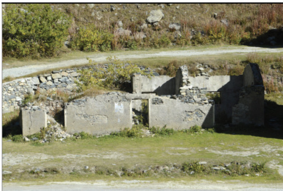
Il fabbricato oggetto di intervento: prospetto SSO