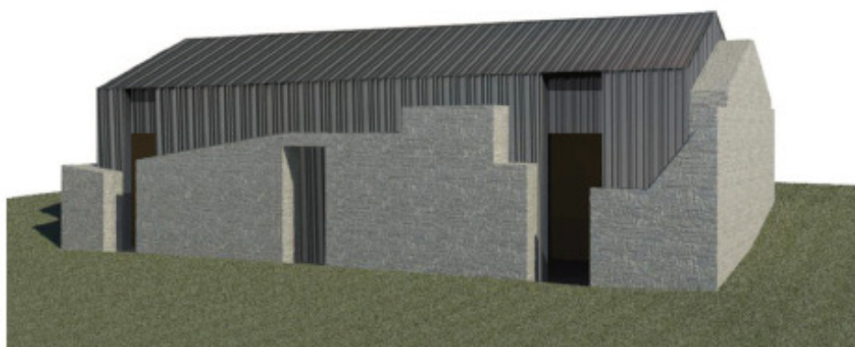
Renderizzazione. Prospetti sud est

L'edificio non sarà dotato di impianti elettrico, di riscaldamento e idrosanitario.