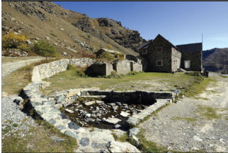
Sorgente nei pressi del complesso