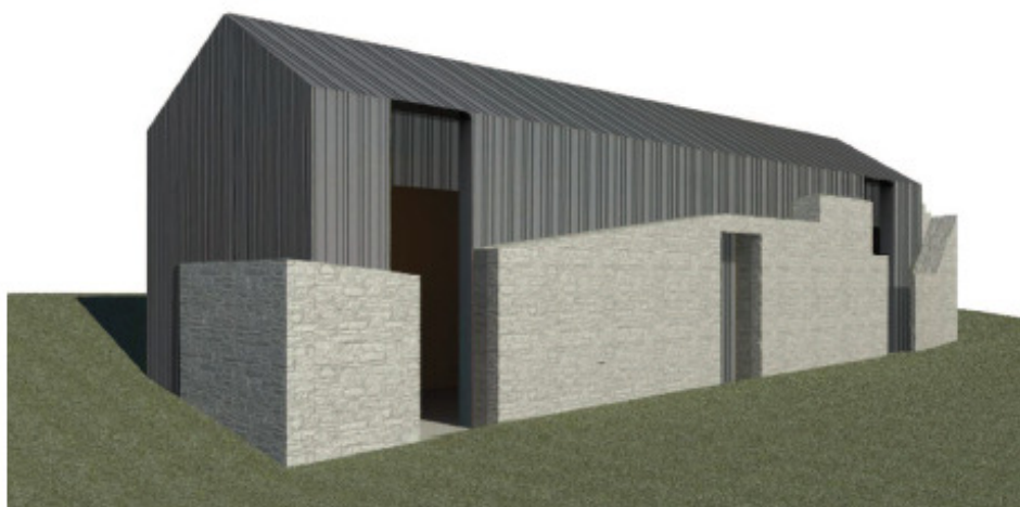
Renderizzazione. Prospetti sud ovest