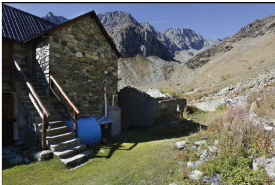
Vista generale dell'accasermamento truppa di Pian del Re ripreso da est