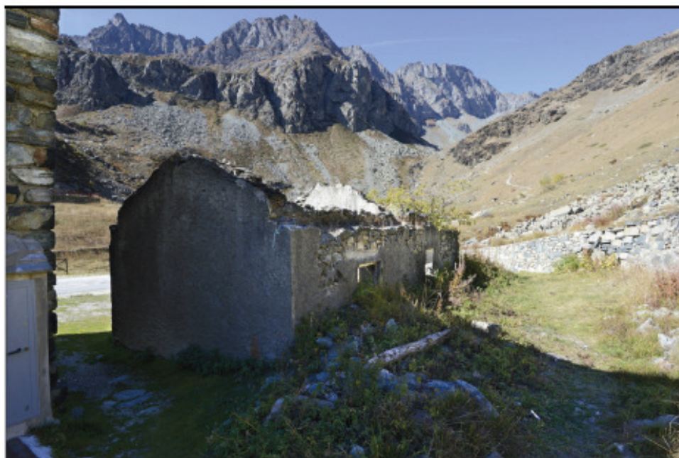
Il fabbricato oggetto di intervento: prospetti ESE e NNE