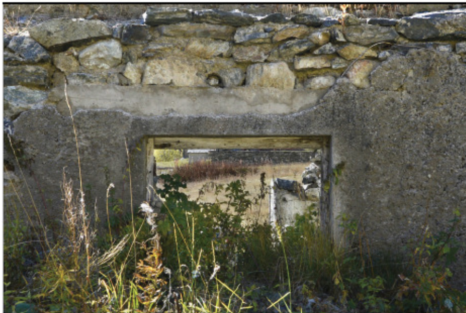
Particolare dell'architrave in c.a. e del telaio ligneo dell'apertura sul prospetto NNE