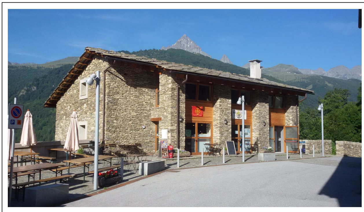
Area circostante e di pertinenza del fabbricato