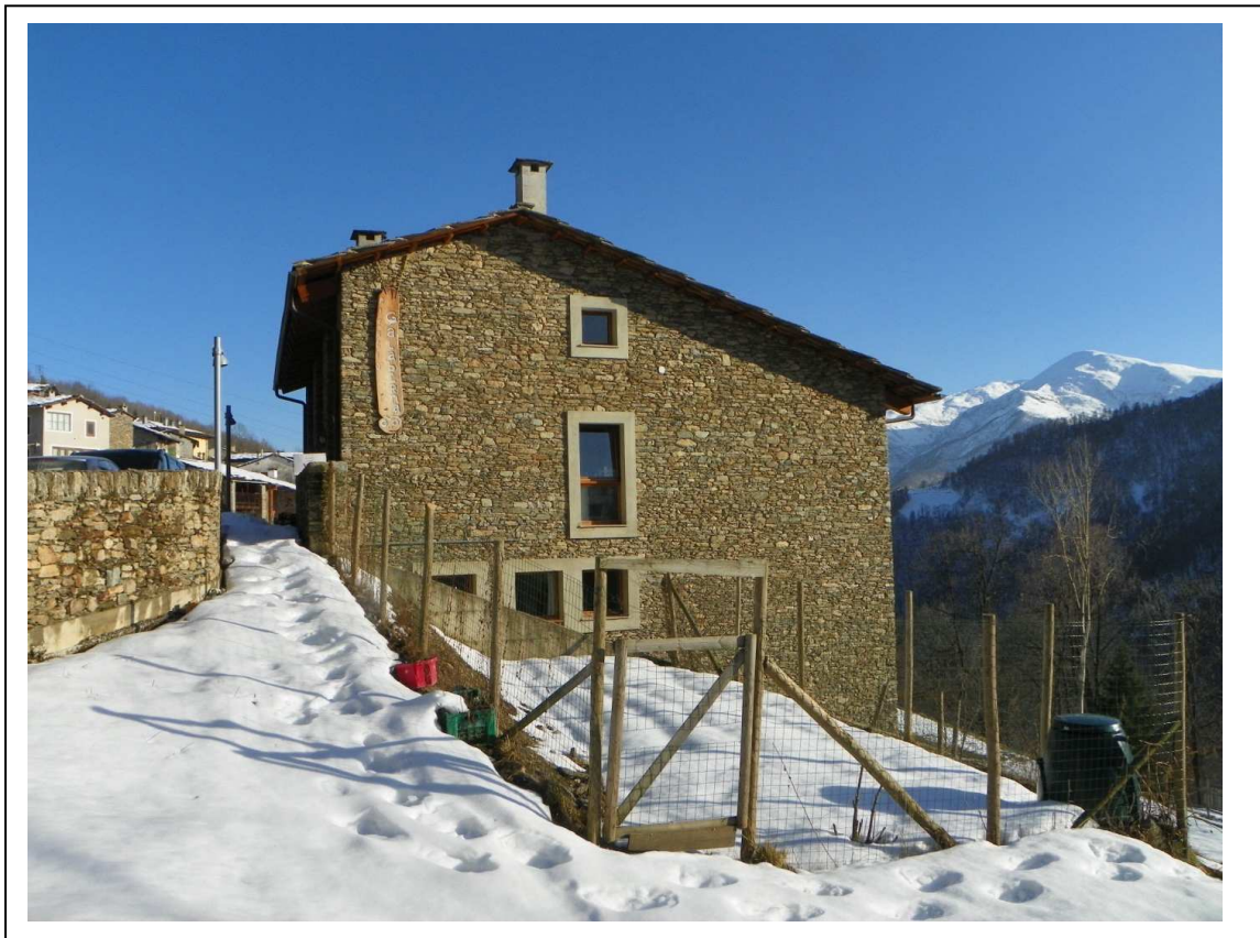
Lato ovest fabbricato