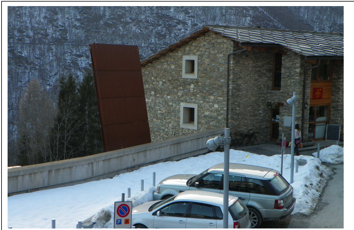
Lato est fabbricato