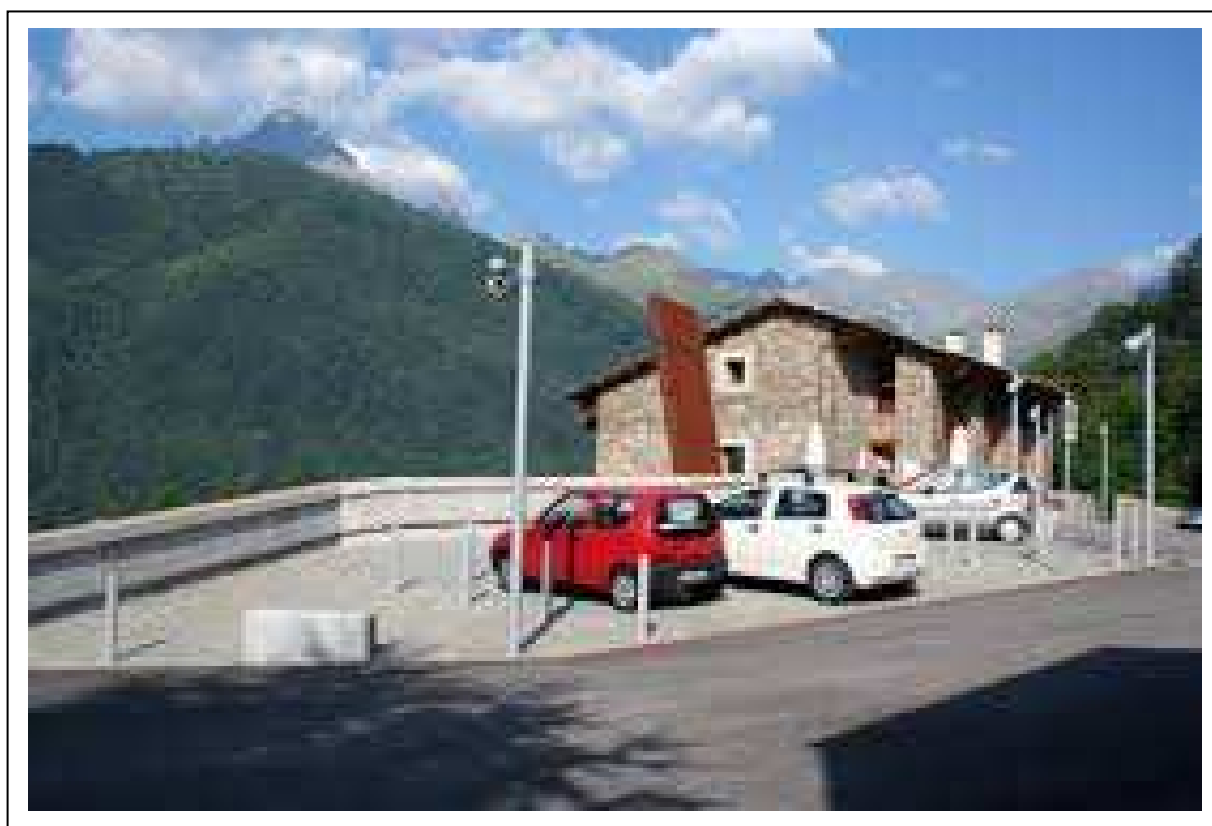
Zona a monte della palestra di arrampicata