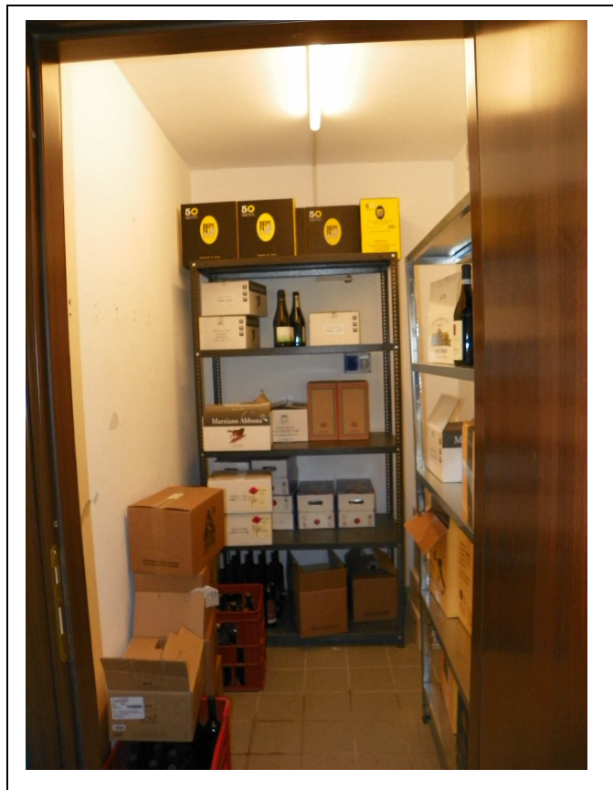
Interno: deposito/cantina - 2 livello seminterrato