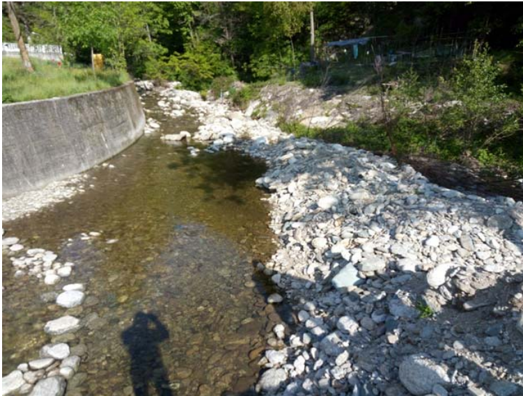
Figura 3: materiale ghiaioso-ciottoloso presente in alveo.