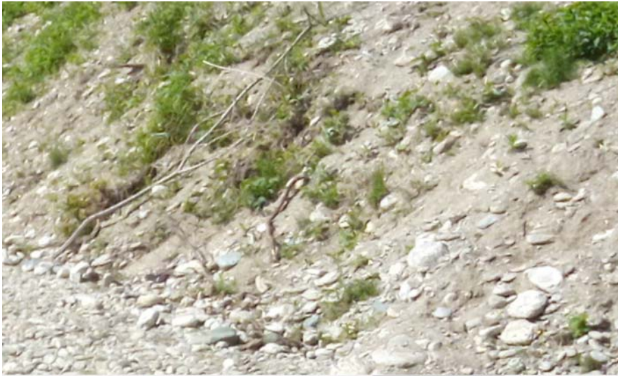
Figura 2: materiale alluvionale rinvenuto i scarpate di scavo.